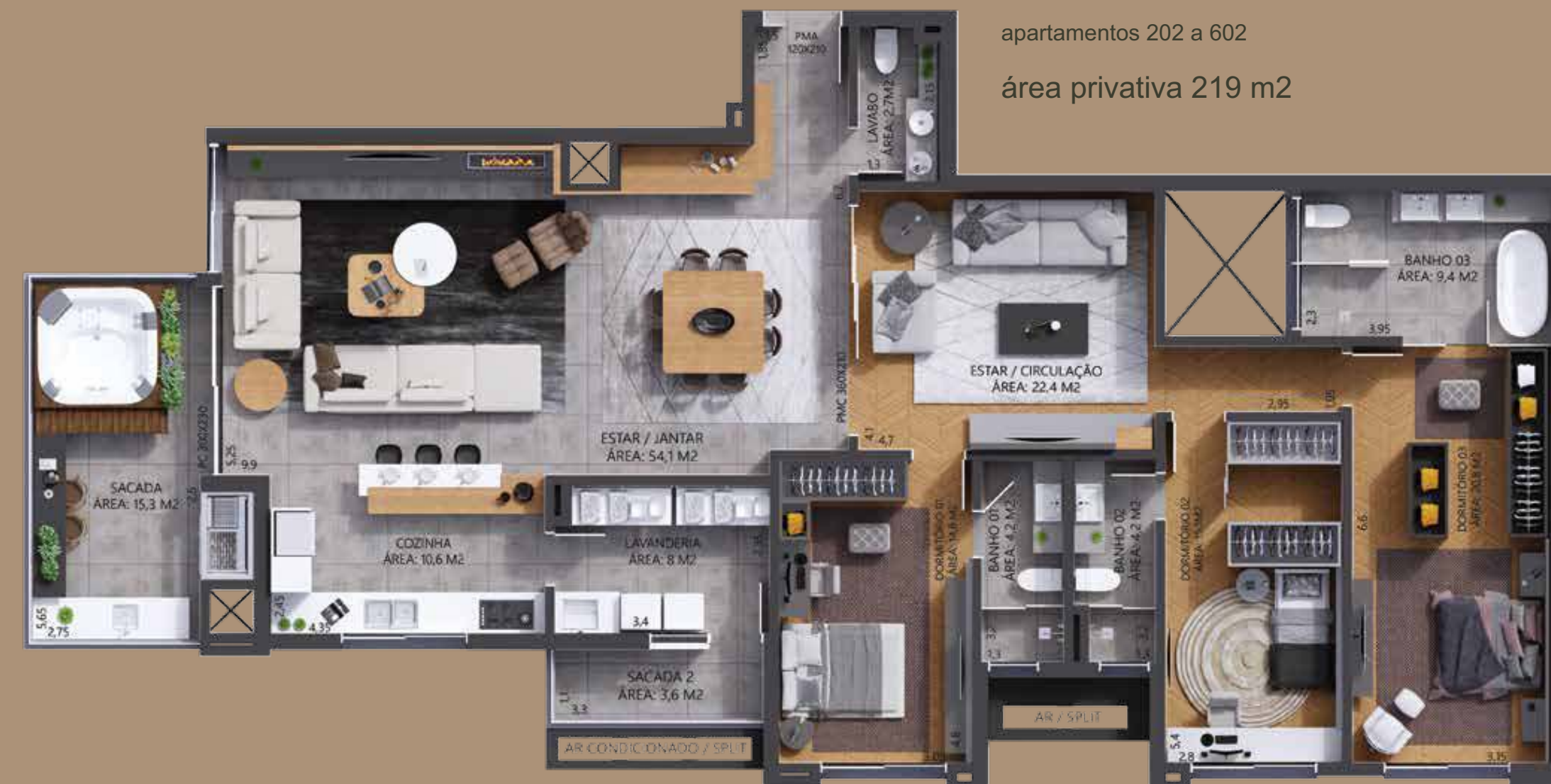
apartamentos 202 a 602 área privativa 219 m 2

Ambiente integrado de living, jantar e cozinha | Uma suíte master com espera para banheira Espaço para closet | Sacada com espera para spa | Duas suítes americanas | Uma suíte Lavabo | Estar íntimo e espaço pra escritório | Churrasqueira reversível | Área de serviço com sacada