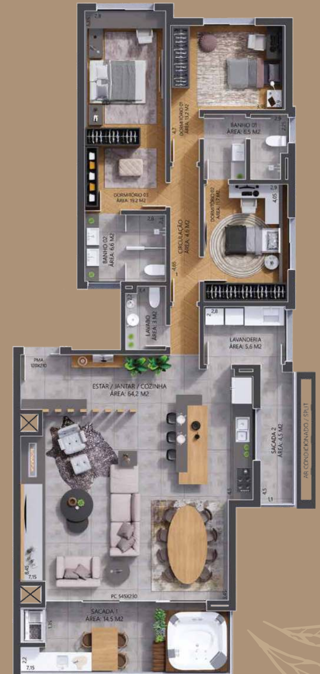
apartamentos 203 a 603 área privativa 181 m 2

Ambiente integrado de living, jantar e cozinha | Sacada com espera para spa Uma suíte master | Duas suítes | Lavabo | Churrasqueira | Área de serviço com sacada