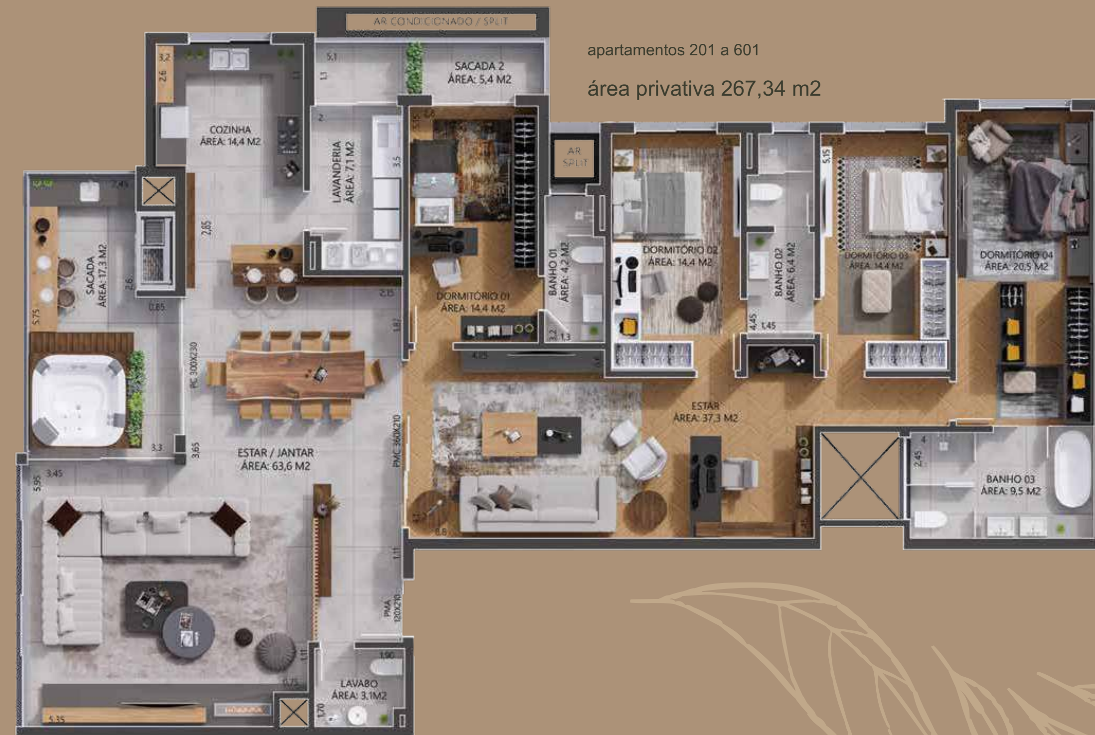
apartamentos 201 a 601 área privativa 267,34 m 2

Ambiente integrado de living, jantar e cozinha | Uma suíte master com espera para banheira Espaço para closet | Sacada com espera para spa | Duas suítes americanas | Uma suíte Lavabo | Estar íntimo e espaço pra escritório | Churrasqueira reversível | Área de serviço com sacada